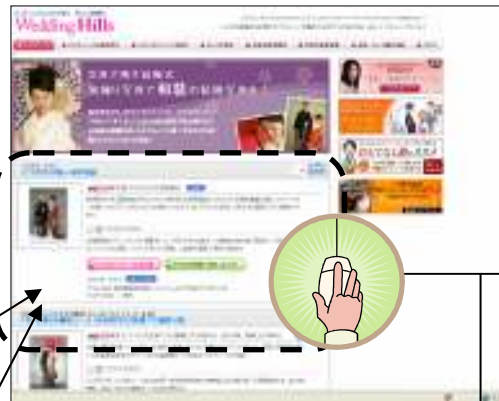
各婚礼サイトの広告企画