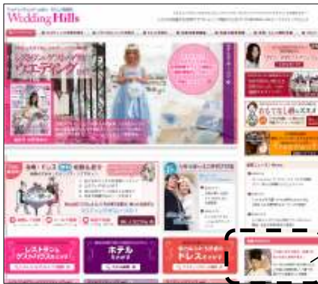
各婚礼サイトのTOP画面